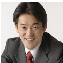
民主党参議院議員 千葉県選挙区の