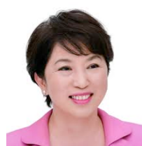
社民党参議院議員 全国比例区の